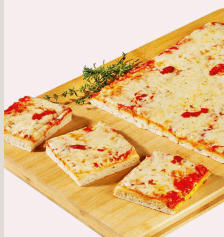
BIO Blechpizza Margherita*

BIO Blechpizza aus Italien, belegt mit einer Tomatensoße und Mozzarella (Größe ca. 28 cm x 48 cm)