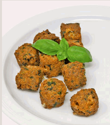
HOFMANNs Veggie Balls gebratene, vegetarische Bällchen nach hauseigener Rezeptur aus Erbsen- und Sonnenblumenprotein, mit Spinat und Mozzarella