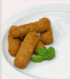
Vegetarische Röllchen gefüllt mit Frischkäse