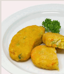
Gemüseschnitzel vorgebacken, mit Karotten, Blumenkohl, Erbsen, Mais und Kartoffeln