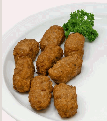
Puten-Cevapcici gebratene Geflügelfleischröllchen