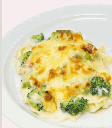
Broccoli-Nudelaufbau mit Käse überbacken