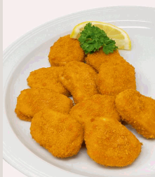
Chicken Crossies panierte Hähnchenbruststücke aus feinzerkleinertem Hähnchenbrustfleisch