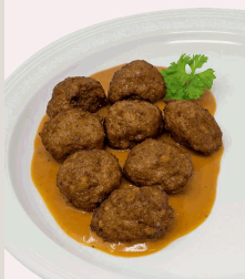
Köttbullar Rindfleischklößchen nach schwedischer Art in Preiselbeer-Rahmsoße