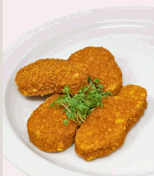
Plant based Nuggets panierte vegane Nuggets auf Basis von Schwarzwurzeln, Jackfrucht, Blumenkohl und Borlottibohnen