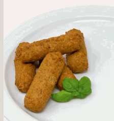
Vegetarische Röllchen gefüllt mit Frischkäse