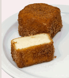
Kartäuser Klöße "Arme Ritter" Hefengebäck in Pflanzenfett ausgebacken