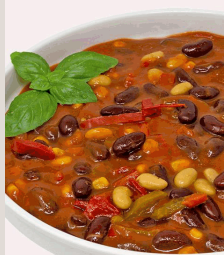
Chili sin Carne Eintopf mit Kidney-Bohnen, Paprika, Tomaten, Mais und weißen Bohnen